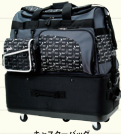
キャスターバッグ