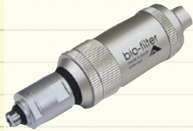
バイオフィルター