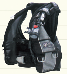
クラシック・ストライダー2