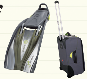
ホットショットフィン&ダイバーチャーバッグ