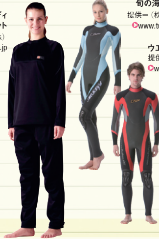
ウエットスーツオーダー券