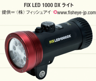
FIX LED 1000 DX ライト